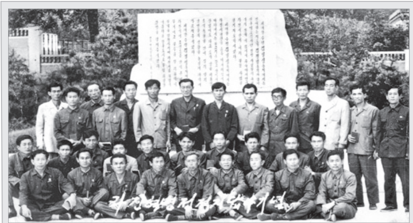
* 출처: 납북자 가족모임 제공, 『조선일보』 2008년 5월 19일.