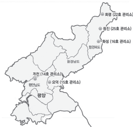
〈그림 11-3〉 정치범 수용소 위치