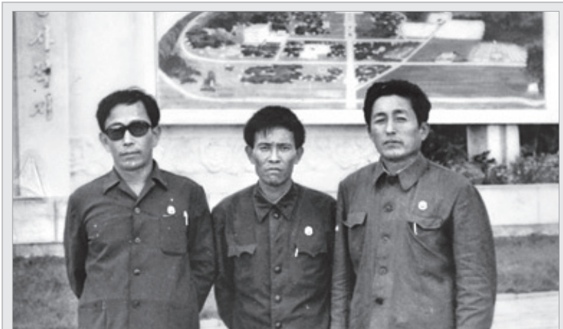
* 출처: 납북자 가족모임 제공, 『조선일보』 2008년 5월 19일.