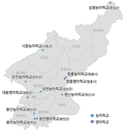
그림 IV-1 북한의 농아학교와 맹아학교