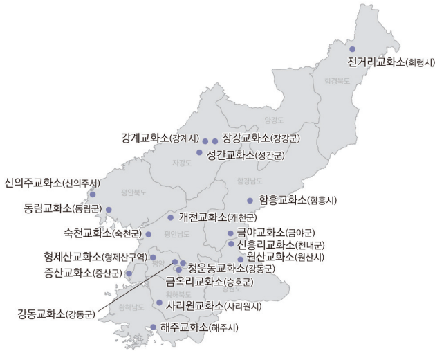
그림 II-1 교화소 위치

탈북 후 강제송환된 북한 주민이 북한 형법상 ‘비법국경출입 죄’ 45 로 노동교화형을 선고 받은 후 주로 수용되는 곳이 전거리