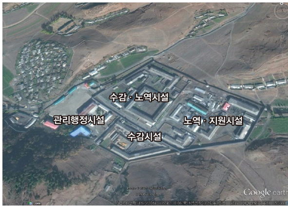
그림 II-4 위성사진으로 본 개천교화소

개천교화소는 남자동과 여자동으로 구분되어 있으며, 여자동은 다시 무기노동교화형을 받은 수형자들이 있는 무기동과 유기노동교화형을 받은 수형자들이 있는 유기동으로 구분되어 있는 것으로 파악된다. 51 여자 무기동과 유기동은 별도의 건물에 있다고 한다. 52 무기노동교화형을 받은 여성 수형자가 수용되는 것으로 볼 때 개천교화소는 중범죄자 수용시설인 것으로 보