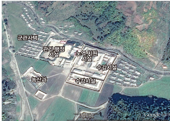
그림 II-2 위성사진으로 본 전거리교화소

전거리교화소는 1과부터 5과까지 수형자를 나누어 관리하고 있는 것으로 파악된다. 남성 수형자는 1, 2, 4, 5과에 편성되어 있고, 여성 수형자는 3과에 편성되어 있다고 한다. 46 각 과는 다시 반으로 분류되는데, 1과는 12개 반 정도, 2과와 3과는 각