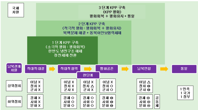
<그림 1> 한반도 평화프로세스 진전구도

(X: 단절, △: 제한적 협력, O: 협력, ⊙: 협력심화, ●: 제도적 협력)